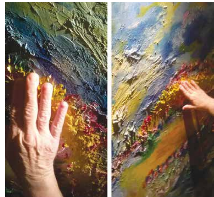
Experiencia táctil con la obra Luz y vida .